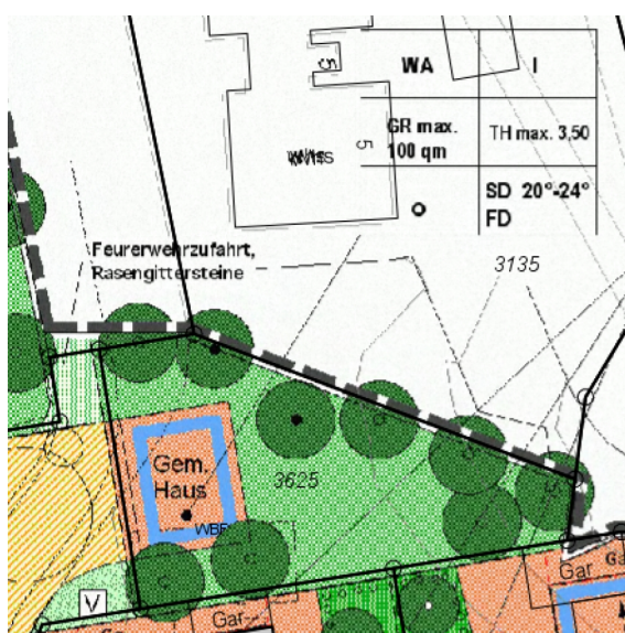
Bebauungsplan „Schelmengrube“ mit 1. Änderung

Sämtliche Festsetzungen des Bebauungsplans „Schelmengrube“ mit seiner 1. Änderung sowie der vorliegenden 3. Änderung sind zeichnerisch und textlich in einem Planwerk zusammengefasst. Soweit die Festsetzungen nicht im Rahmen der 3. Änderung geändert werden, sind diese übernommen und lediglich redaktionell aufeinander abgestimmt worden.