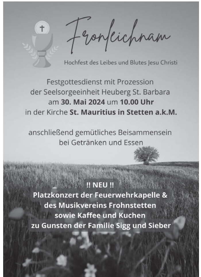
Flyer: Anna Bosch

Mitteilungen für die kirchlichen Nachrichten müssen bei uns im Pfarrbüro bis spätestens Donnerstag 10:00 Uhr eingegangen sein. Später eingegangene Mitteilungen können nicht mehr berücksichtigt werden oder werden im darauffolgendem Amtsblatt veröffentlicht. Wir bitten um Ihr Verständnis. Vielen Dank.