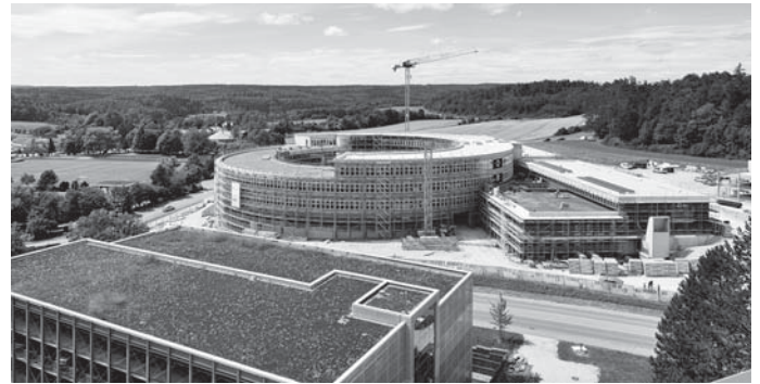
Pünktlich zum Beginn des Schuljahres 2025/26 soll die Bertha-Benz-Schule im Neubau den Betrieb aufnehmen.