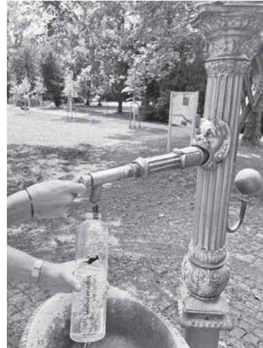
Eine wiederverwendbare Wasserflasche lässt sich jederzeit nachfüllen – sogar unterwegs.

Obst und Gemüse wie Wassermelonen, Gurken oder Erdbeeren haben einen hohen Wassergehalt und tragen zur täglichen Flüssigkeitszufuhr bei. Auch Suppen und Eintöpfe können helfen, den Flüssigkeitsbedarf zu decken. Besonders im Sommer sind kalte Suppen mit Zutaten wie Gurke, Melone oder Minze eine tolle Option für etwas mehr Erfrischung.