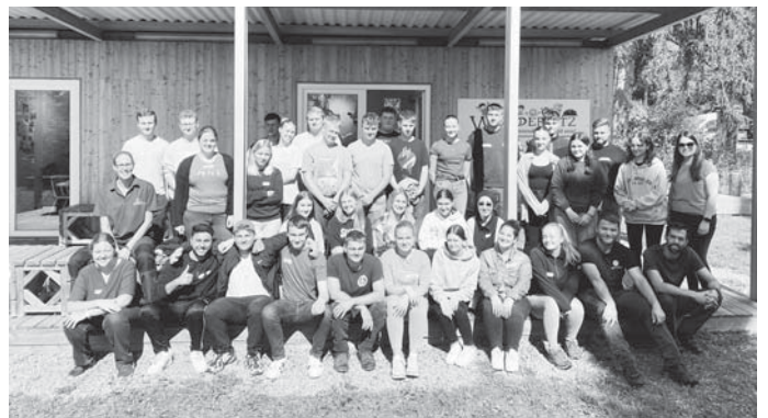
Während der Einführungswoche besuchen die neuen Auszubildenden und Studierenden unter anderem die Waldschule Wunderfitz.