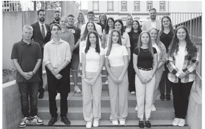
Für die Auszubildenden und Studierenden beginnt beim Landkreis Sigmaringen ein neuer Lebensabschnitt.