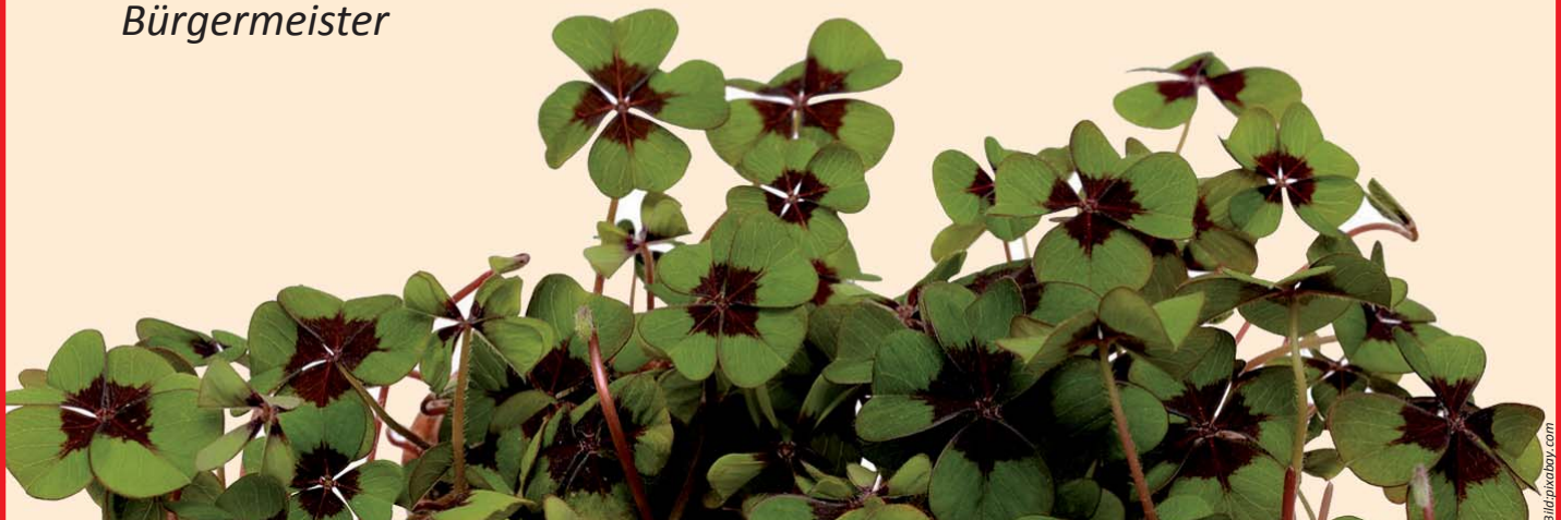
Maik Lehn Bürgermeister