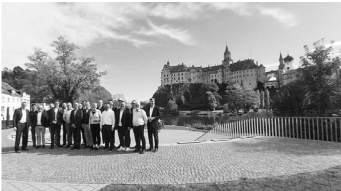
Vor der Kulisse des Hohenzollernschlosses tagten die Mitglieder des Ausschusses für Planung und Klimaschutz des Verbands Deutscher Verkehrsunternehmen (VDV) in Sigmaringen.

Der Ausschuss für Planung und Klimaschutz beschäftigt sich mit allen Aspekten eines nachhaltigen Verkehrsangebots. Seine Mitglieder sind die Spitzen von ÖPNV-Unternehmensleitungen und Experten in der Mobilitätsplanung. Der VDV vertritt die Interessen von rund 600 Mitgliedsunternehmen, die sich für die Förderung und Weiterentwicklung eines leistungsfähigen und umweltfreundlichen Verkehrssystems in Deutschland einsetzen.