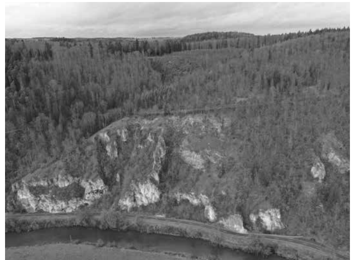
Freigestellter Felskomplex bei Thiergarten; Fotografie: Thomas Bamann,

Die Möglichkeit für Arten zwischen den verschiedenen Räumen zu wandern und sich genetisch auszutauschen ist eine wichtige Voraussetzung für die langfristige Erhaltung der biologischen Vielfalt - und überlebenswichtig für Tiere und Pflanzen, die durch den Klimawandel in andere Gebiete ausweichen müssen. Eine intakte Natur ist auch Lebensgrundlage des Menschen. Die Felsköpfe im Oberen Donautal sind wichtige Mosaikbausteine der biologischen Vielfalt in Baden-Württemberg. Eine hohe Biodiversität ist wie eine Lebensversicherung für uns und künftige Generationen. Denn Vielfalt ist das wichtigste Überlebensprinzip in der Natur, es erzeugt Stabilität. Nur bei einer hohen Artenvielfalt und einer großen genetischen Bandbreite innerhalb einer Art ist die Natur in der Lage, mit veränderten Bedingungen zurechtzukommen: mit veränderten Klimabedingungen, neuen Krankheiten oder Schädlingen. Durch die vom Regierungspräsidium finanzierten, teils aufwändigen Pflegemaßnahmen, ist es in den letzten sechs Jahren gelungen, Teile der verbuschenden Felsbereiche wieder freizustellen und als Lebendgrundlage für die gefährdeten Arten der Trockenrasen wiederherzustellen.