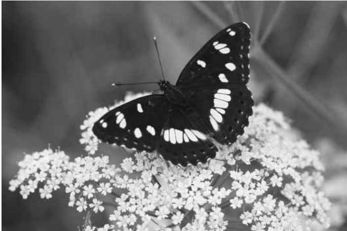
Blauschwarzer Eisvogel; Fotografie: Thomas Bamann.