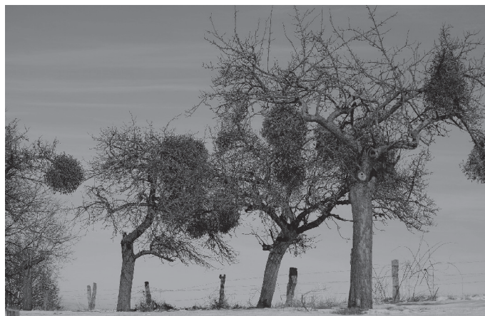
Ohne aktive Gegenmaßnahmen können Misteln für Streuobstbestände zu einer ernsthaften Bedrohung werden.