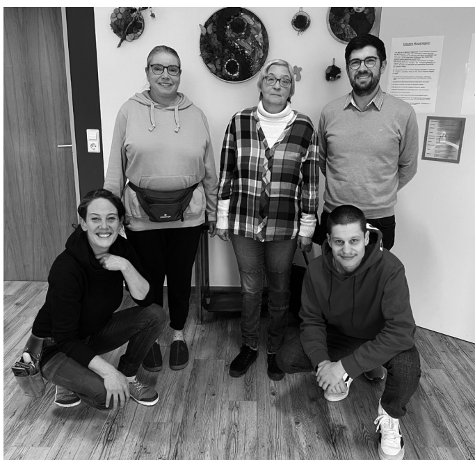
Besucher und MitarbeiterInnen der Begegnungsstätte für psychisch kranke Menschen hoffen auf Spenden für die notwendige Raumerweiterung.

Verwendungszweck: P29186 - Erweiterung Begegnungsstätte für psychisch kranke Menschen